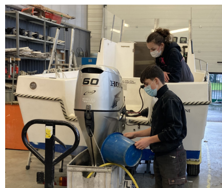
Réaliser des essais, mettre en conformité