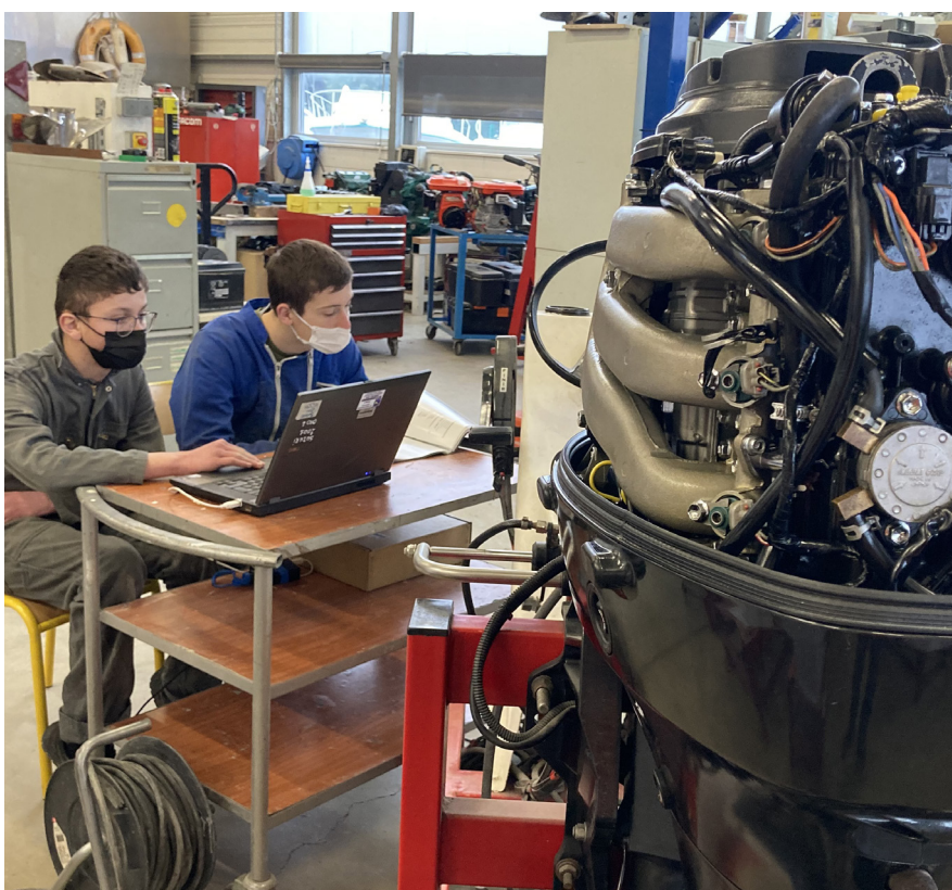
Effectuer un diagnostic avec un outil informatique