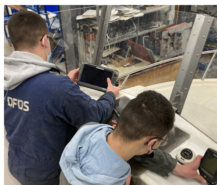
Installer des équipements d'aide à la navigation