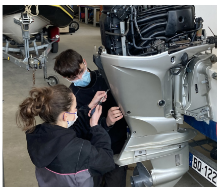
Effectuer de la maintenance préventive

Objectif : acquérir des compétences pour s'insérer ou poursuivre des études.