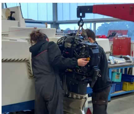
Motoriser une embarcation

Le diplôme permet de s'insérer dans la vie active. Il permet aussi de poursuivre ses études en BTS avec un bon dossier ou encore en FCIL (formation complémentaire d'initiative locale).