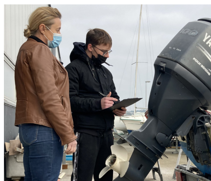
Accueillir, conseiller le client

Lycée maritime Pierre Loti, Paimpol - 2022