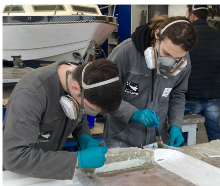
Réparer une coque