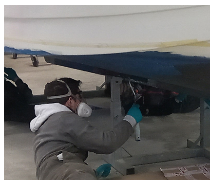
Entretenir les carènes des navires