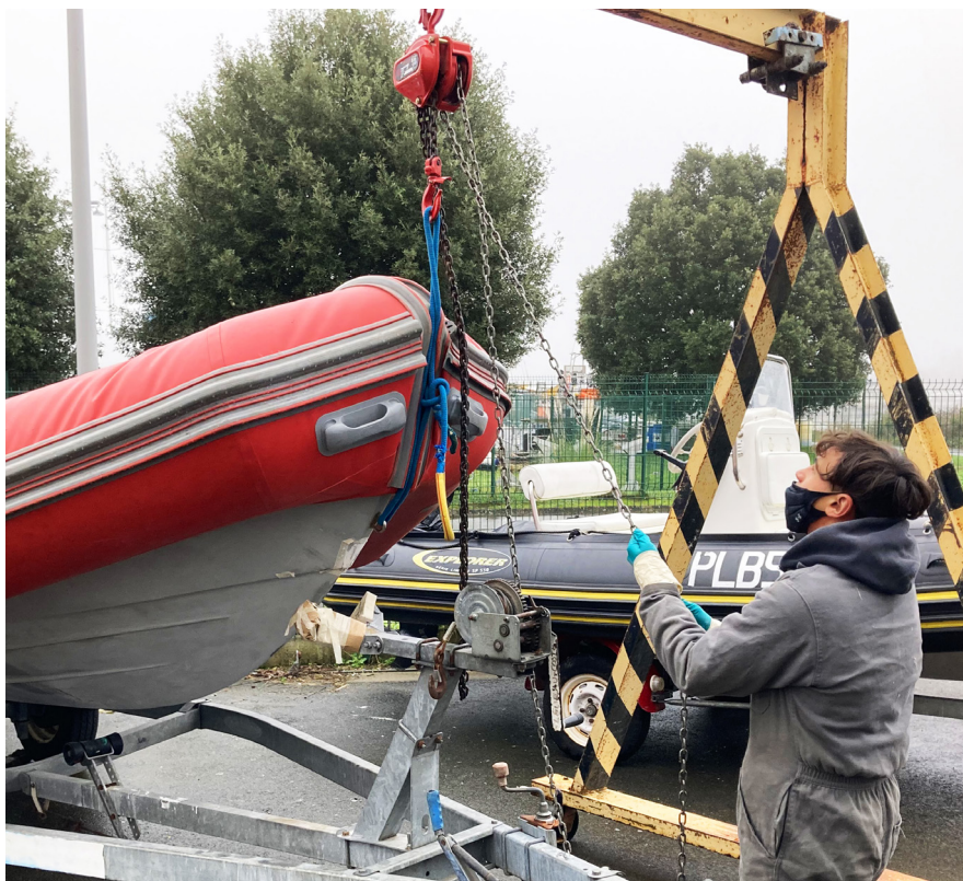
Poser et déposer une embarcation en toute sécurité

Un bac pro pour apprendre à entretenir et réparer les embarcations de plaisance. Au programme, électricité, électronique, hydraulique, mécanique, plasturgie... On apprend à accueillir le client, effectuer un diagnostic de panne sur un bateau et réaliser les réparations.